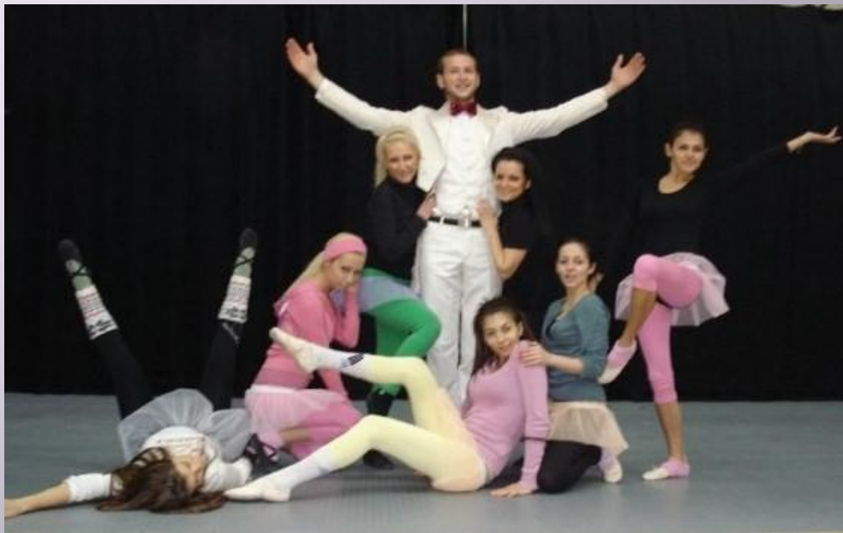
“Кабаре” музика Джон Кендър