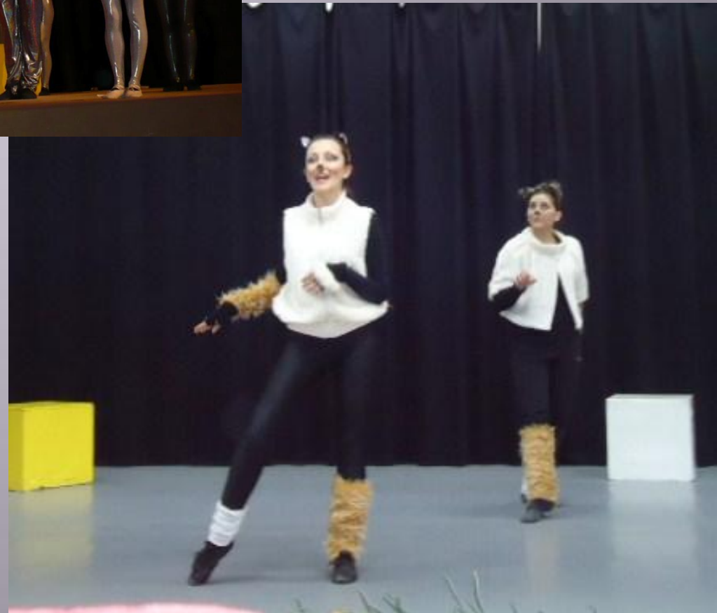
“Котки” музика Е. Л. Уебър