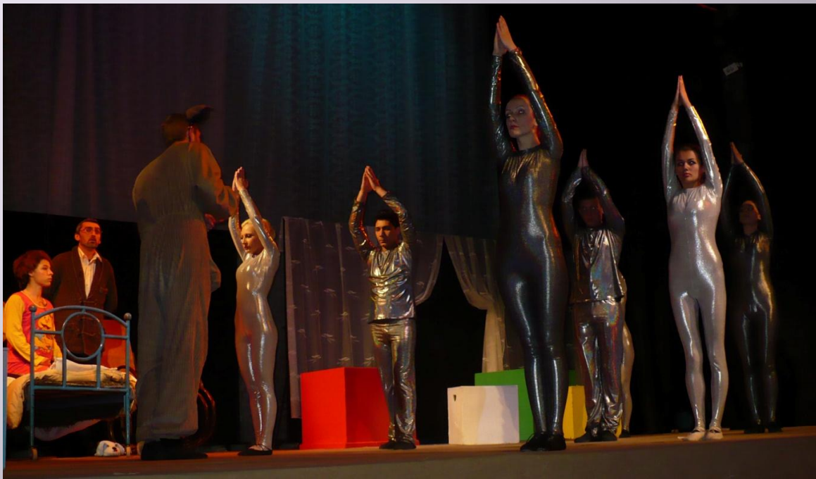
“Копче за сън” текст Валери Петров музика Георги Генков