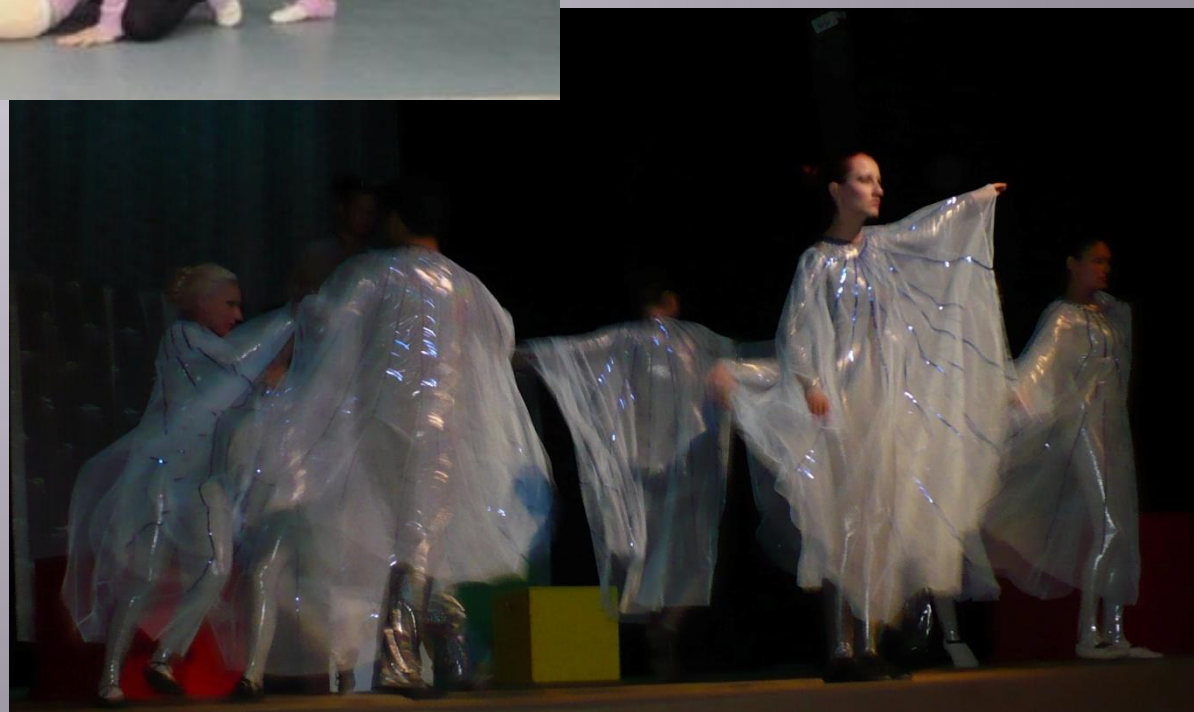
“Копче за сън” текст Валери Петров музика Георги Генков